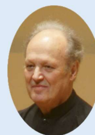
Vn/ヴェセリン パラシュケヴォフ

ブルガリア、ソフィア近郊で生まれる。ソフィアの国家試験を最優秀で終えた後、レニングラード(現サンクトペテルスブルク)で、ミッシャ・ファイマン教授に師事、その後ウイーンでマイスターコース、ジュネーブでヘンリック・O・シェリングの指導を受ける。1973年からウィーンフィルのコンサートマスター、1975年からケルン放送交響楽団の第一コンサートマスター、1980年サシコ・ガブリロフ教授の後任としてエッセン音楽大学教授に招かれ就任、2019年に退任。演奏活動はヨーロッパ各地、アメリカ、ロシアにわたり、日本でも、指導者、ソリストとして東京・大阪を中心に活動。現在はコロナ禍によりドイツ国内以外の活動は中断中。