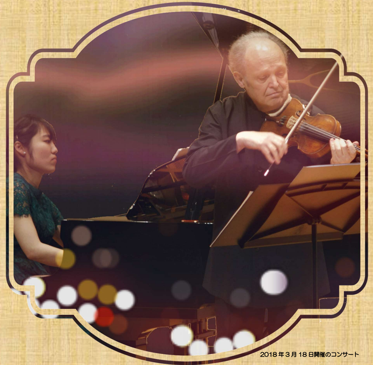
2018年3月18日開催のコンサート