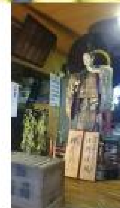
仲秀英製作の「小野道風」